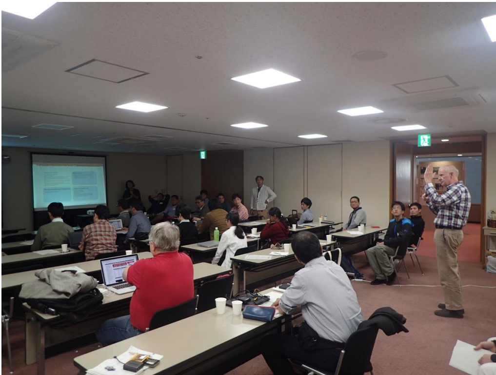
会議中議論の様子